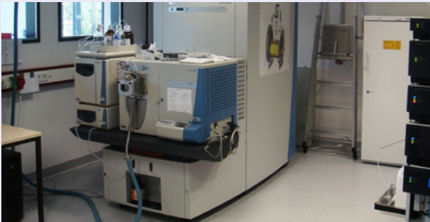
Teil der Gerätelandschaft im Leibniz-Institut für Analytische Wissenschaften Dortmund: Massenspektrometer und digitale Analysegeräte

Darum sind wir von der temporären Ticket-Lösung und Gästeverwaltung mit macmon so begeistert“, so Hinrichs. Der macmon guest service bietet dafür alle Voraussetzungen: das Management- und Reporting-System gewährleistet auch für Besucher mit Geräten wie Smartphones, Netbooks oder iPads einen kontrollierten und zeitlich steuerbaren Netzwerkzugang.